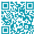
Professional-les du 147 (whatsapp, appel, mail)

Il ne faut pas hésiter à demander de l'aide.