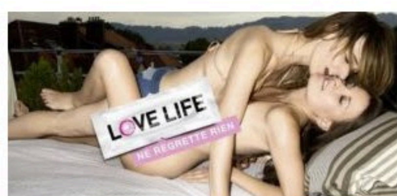
Une image de la campagne « Love Life » de 2015... Représentatif ?

Cette expression à rallonge désigne toutes les femmes qui pratiquent du sexe avec d'autres femmes... Volontairement large de sens, car toutes les femmes concernées ne se considèrent pas lesbiennes ou bisexuelles. Les professionnel-l-e-s de la santé utilisent le sigle « FSF » et pour une légèreté de rédaction, FSF fera l'affaire.