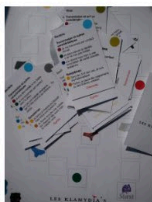
Image du premier jeu des Klamydia's sur les IST.