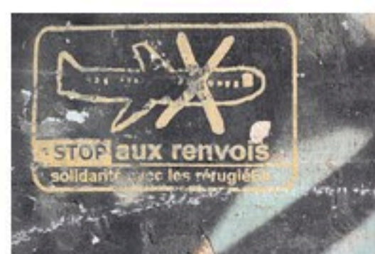
Cet asile qui rend fou